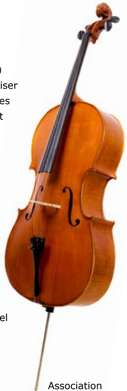
Association Musiques & Seniors

En 2022, nous poursuivrons les mesures prises en 2021 pour continuer de progresser et renforcer notre conseil aux associations.